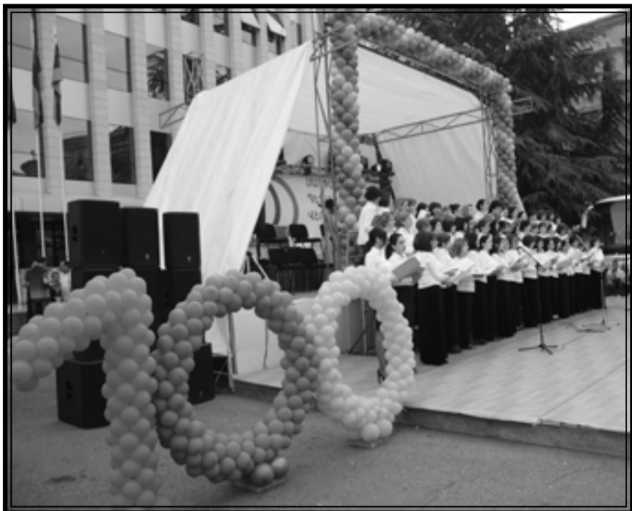
Կապան, Փարեգին Նժդեհի հրապարակ