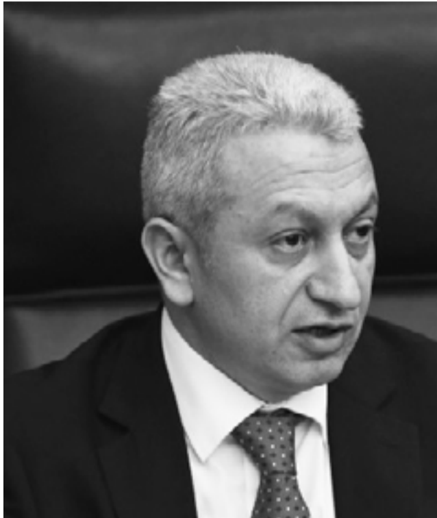
Հարգելի պարոն նախարար

Հայաստանի Հանրապետության կառավարության 2016թ. դեկտեմբերի 15-ի N1299-Ն որոշմամբ ստեղծվել է Սյունիքի մարզի զարգացման և ներդրումների հիմնադրամ: