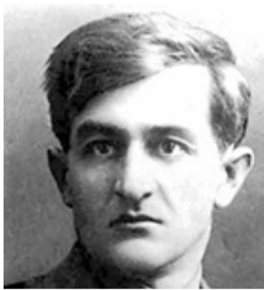
Երկրի ողբերգության ականատեսը եւ մաքառումների մասնակիցը: ՀՐ.ԹԱՄԱՐԱՅԱՆ «Սովետահայ գրականության պատմություն», էջ 430

1917 թվականին թուրքական ճակատում տեղի էին ունենում ծանր կռիվներ: Մուգ կապույտ աչքերով թախծոտ պատանին, որի հայացքի եւ շարժման մեջ կար «ինչ-որ էլեգիական բան», աղետի օրերին դրսևորում է ոգու կրողը: 1917թ. ճեմարանական ուսանողների հետ մեկնում է Երզրումի ճակատ՝ որպես շարքային: Ամբողջ մի տարի նա մասնակցում է կռիվներին եւ ճաշակուն մահացի բոլոր դառնությունները: Սարիղամիշ, Կարս, Սուրմալու, կորուստների այս ուղին անցնելի հետք է թողնում նրբագագ գինվորի վրա: Վերջապես, 1918թ. մայիսին պատանի զինվորը մասնակցում է Սարգարապատի հերոսական ճակատամարտին: Չարենցի պես նա էլ դառնում է հինավուրց